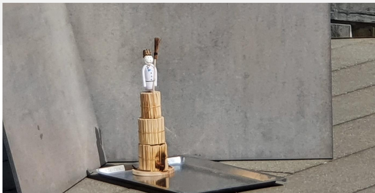
„Mini Böögg“ vom Haus Tabea

Traditionen sind auch in dieser speziellen Zeit wichtig. Das Küchenteam hat deshalb für jeden Bewohnenden zum Dessert einen kleinen „Böögg“ gebacken.