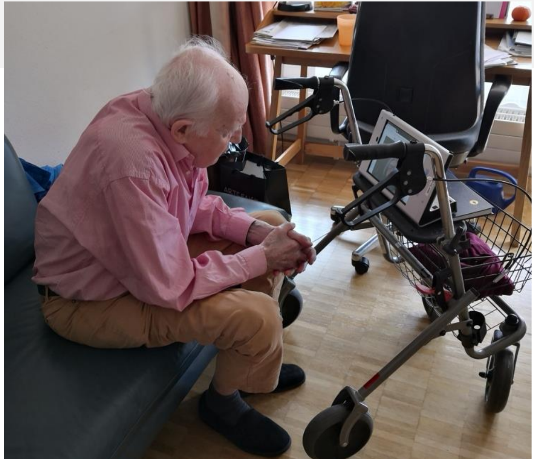
Bewohner beim Video Gespräch mit Angehörigen