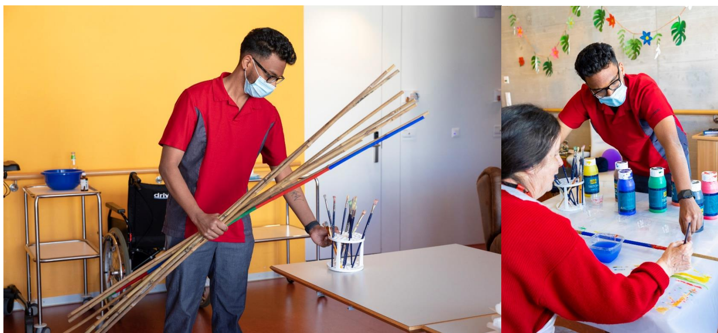
Zivilschützer im Einsatz

Betreuung durch die Zivilschützer sowie die Möglichkeit, auch einmal mit „nicht Haus Tabea Personal« zu plaudern. Die Heimleitung schätzt die hohe Professionalität und Selbstverantwortung, sowie die sehr motivierte und engagierte Einstellung der Zivilschützer. Nach ihrem Einsatz für den Zivilschutz, wird die Truppe Ende Mai wieder in ihr gewohntes Arbeitsleben zurückkehren. Sie alle haben nämlich spannende Berufe und arbeiten zum Beispiel als Kondukteur bei der SBB, Verkaufsberater im Hornbach oder als Servicemitarbeiter in einem Restaurant. Wir möchten uns an dieser Stelle bei Euch allen ganz herzlich für Euren Einsatz bedanken! Ihr seid in dieser Zeit richtige «Tabeaner» geworden! Euer Einsatz für unser Haus war eine enorme Hilfe. Wir freuen uns, wenn wir Euch nach Corona zu einem Kaffee hier im Haus für ein Wiedersehen einladen dürfen!